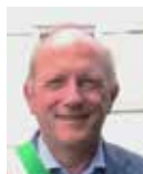
Baseggio Antonello Sindaco