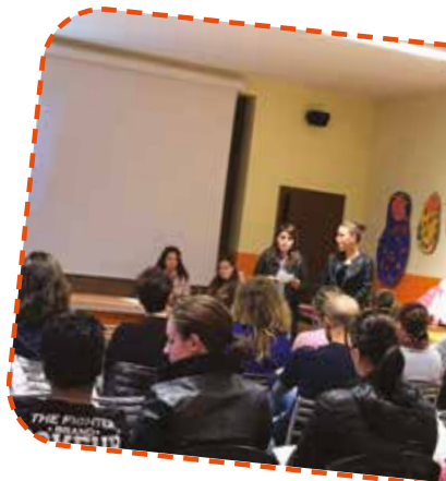
Andiamo nelle scuole e negli asili a far conoscere il progetto