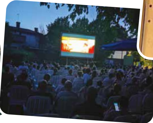
Monica Gambarotto Assessore alla Cultura e al Bilancio