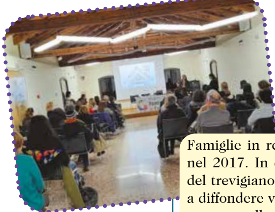
Organizziamo serate di formazione con le altre reti

Famiglie in rete è un progetto giunto a Ponzano nel 2017. In collaborazione con altri 14 comuni del trevigiano e la Cooperativa Kirikù, si impegna a diffondere vicinanza e solidarietà per creare benessere nella comunità che tutti noi abitiamo.