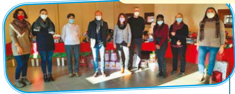
Nei periodi di festa ci siamo impegnati con iniziative per donare sorrisi a grandi e piccini