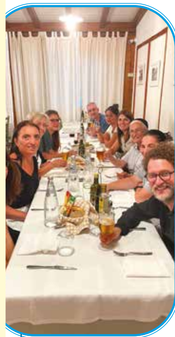
Le occasioni per fare gruppo non mancano mai, sia tra volontari ma anche con il resto della comunità!