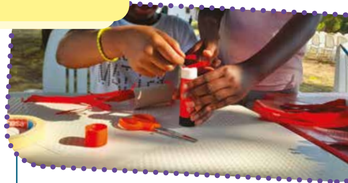
Ci troviamo anche in estate per giocare e imparare cose nuove divertendoci