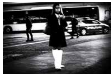
Visioni Fotografiche “Questi Bravi ragazzi” Stivali bianchi