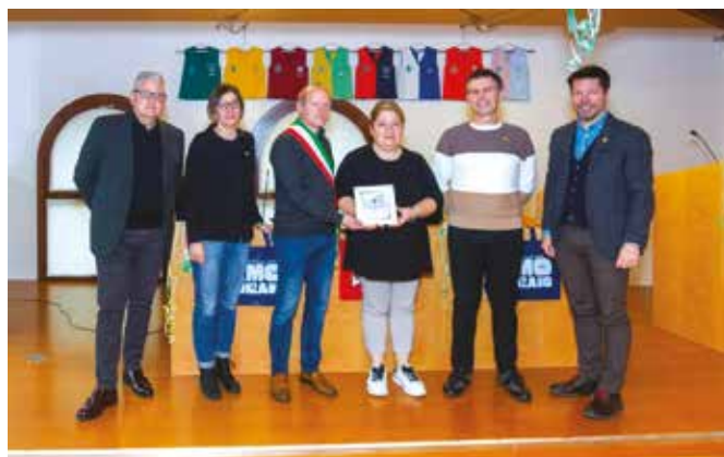
Trattoria da Rosa e Gian