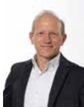
Antonello Baseggio Sindaco