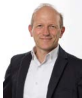
Antonello Baseggio Sindaco