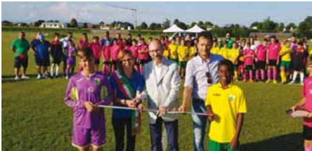
da sinistra a destra: il Sindaco, il Delegato Prov.le Coni Ottoni, Vice presidente Ponzano Calcio Basso

riconfermata "Scuola Calcio Élite", e l'associazione si è assunta l'onere della manutenzione dell'impianto. Le associazioni sportive hanno il merito di portare