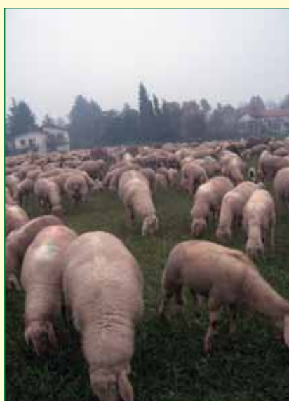
La fotografia: Merleno 28 novembre 2005

Il circolo Auser "Il chicco di grano" nasce a Ponzano nel gennaio 2005 dalla volontà di alcune donne di stare assieme e occupare un po' del loro tempo per l'aiuto agli altri, ispirandosi ai valori della consapevolezza, della solidarietà e della responsabilità. L'Auser è, infatti, un'associazione nazionale che rappresenta una proposta di valori, di cultura e di stili di vita rivolta prima di tutto alle persone anziane. L'impegno sul terreno della solidarietà si concretizza nell'attività di volontariato. L'Ufficio Servizi Sociali del Comune ci ha segnalato alcuni casi di persone bisognose di compagnia e di accompagnamento per acquisti. La volontà di stare assieme si sta realizzando con il programma "Impariamo